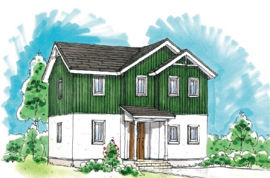
※外観はイメージです